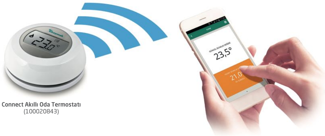
Connect Akıllı Oda Termostatu (100020843)